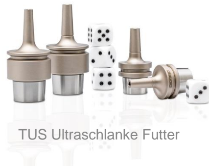
TUS Ultraschlanke Futter