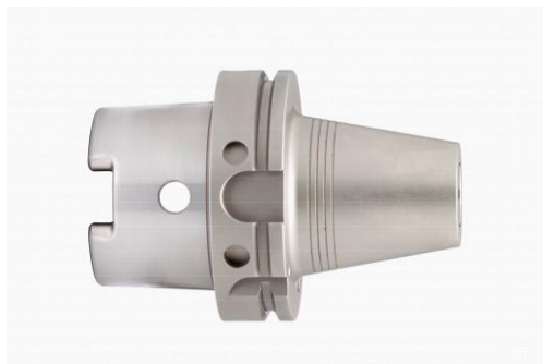
Pyroquart HSK-A 100

Pyroquart® steht für exzellente Qualität und Spannfutter mit außergewöhnlicher Haltekraft. Pyroquart® Schrumpffutter sind aufgrund ihrer kompakten und stabilen Bauart für die Schwerzerspanung bestens geeignet.