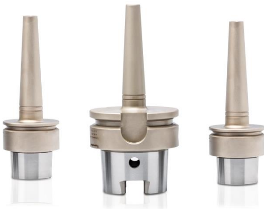
TSF Futter für den Formenbau

Für die Hochgeschwindigkeitsbearbeitung sind Schrumpfaufnahmen die am besten geeigneten Spannmittel für die sehr kleinen Werkzeuge, mehr noch: Hochgeschwindigkeitsmaschinen kommen ohne Schrumpftechnik überhaupt nicht mehr aus. So ist Schrumpfen im Formenbau, in der Automobilindustrie, dem Flugzeugbau und der Aluminiumbearbeitung eine eindeutige Größe. Bedingung für erfolgreiche Anwendung der Schrumpftechnik sind intelligente Schrumpfgeräte und technologisch konsequent hergestellte Schrumpf-Aufnahmen.